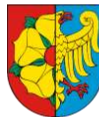
Erb města Wodzisław Śląski