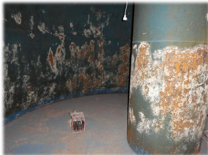
Foto před nátěrem