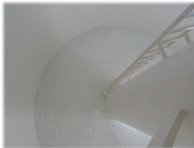
Foto po nátěru